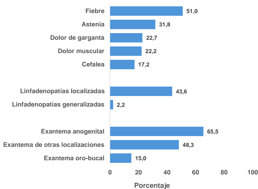
Figura 2. Manifestaciones clínicas de los casos de mpox, 2024

Un total de 268 casos (66,0%) presentaron alguna sintomatología general a lo largo de su proceso clínico (fiebre, astenia, dolor de garganta, dolor muscular o cefalea) siendo la fiebre la más frecuente (207 casos, 51,0%). Ciento setenta y siete casos (43,6%) presentaron linfadenopatías localizadas. El exantema se localizó en la zona anogenital en 266 casos (65,5%), en la zona oral-bucal en 61 casos (15,0%) y en 196 (48,3%) en otras localizaciones (Figura 2).